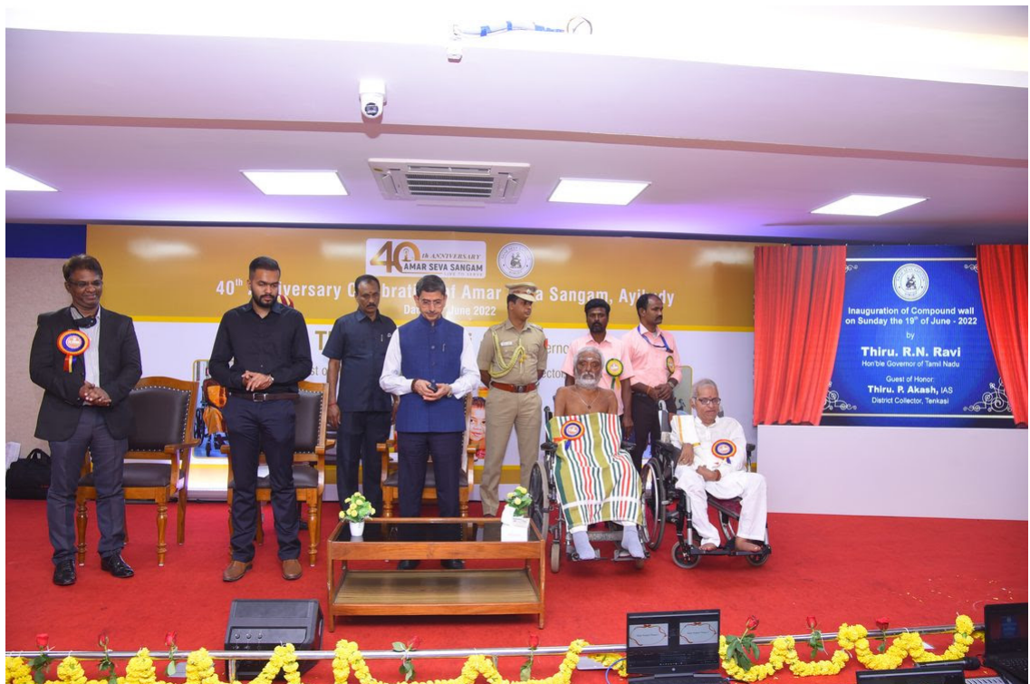
Governor of Tamil Nadu visits Amar Seva Sangam -June 19, 2022